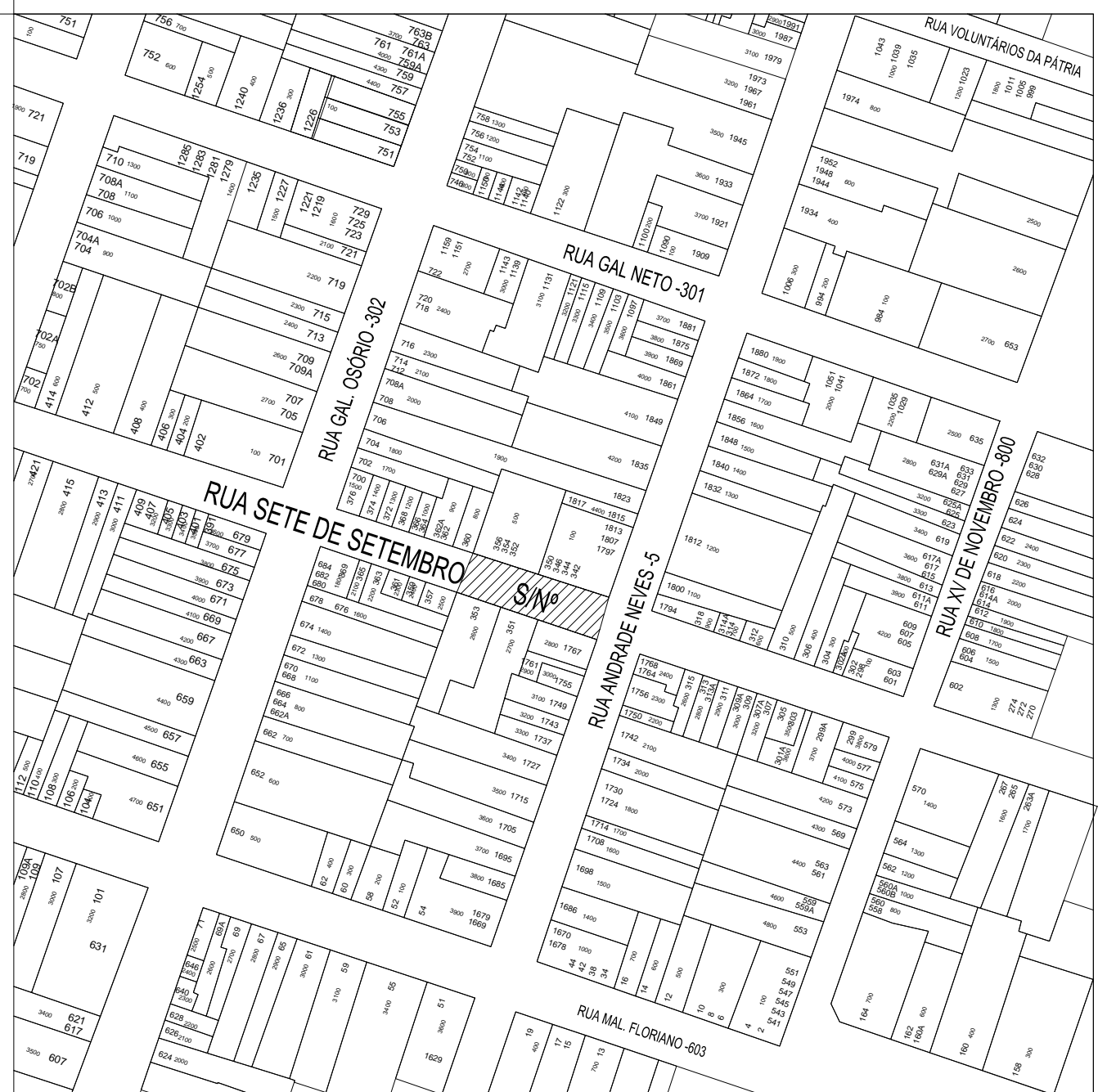
1 PLANTA DE LOCALIZAÇÃO SEM ESCALA